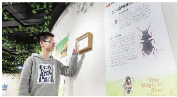
上海动物园乡土昆虫标本展

展览时间：节假日和双休日(4-6月、10月)：13:30-13:50；7-9月：10:00-10:20) 展览地点：灵长动物展区育婴房室外区域(靠近黑猩猩馆、猩猩馆)备注：一、气温低于20摄氏度或高于35摄氏度时，活动取消；二、遇下雨、大风等恶劣天气时，活动取消；三、如遇特殊情况，活动取消，恕不提前告知，敬请谅解！