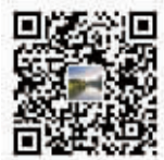
潮涌高桥 敬请关注