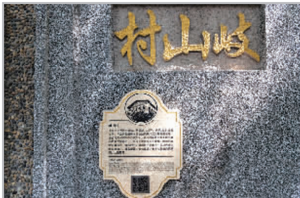
△2005 年，岐山村被列入上海市第四批优秀历史保护建筑。如今 15 幢建筑外立面已完成修缮，精致的雕花、复古的信箱、典雅的窗棂，每一个小细节都在印证它昔日的风华。