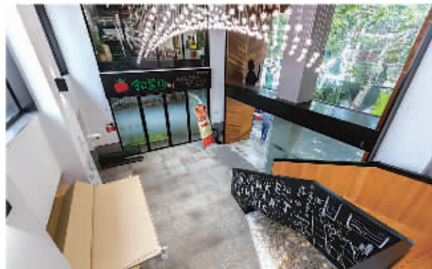
△宏业花园内的愚园公共市集，让柴米油盐与艺术空间成功碰撞出了艺术的火花。