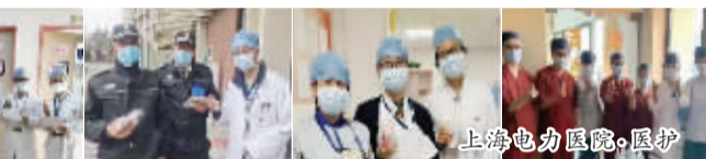
上海电力医院·医护

市长宁区妇幼保健院、上海电力医院、江苏街道社区卫生服务中心同志发出倡议书，成立“抗击疫情党员突击队”，各医院收到数百份”，随时待命，奋战一线。