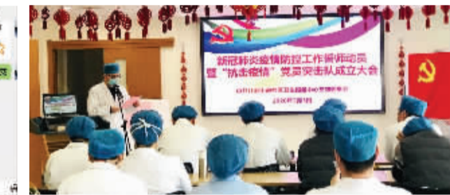
长妇幼·微信截图 & 社区卫生服务中心·抗疫誓师动员

市长宁区妇幼保健院、上海电力医院、江苏街道社区卫生服务中心同志发出倡议书，成立“抗击疫情党员突击队”，各医院收到数百份”，随时待命，奋战一线。